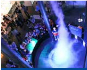
④ 高9米的人工龙卷风