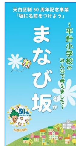
デザインシール例 平針小学校「まなび坂」

平針小学校、植田小学校、植田北小学校 八事東小学校、表山小学校、御幸山中学校 計6小中学校付近 7坂 (八事東小学校のみ2坂)