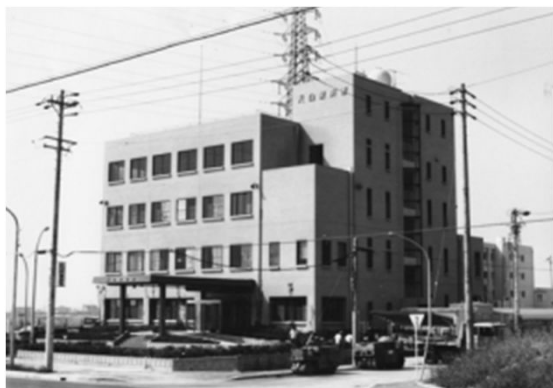
125 完成間近の天白警察署 (昭和54年頃)