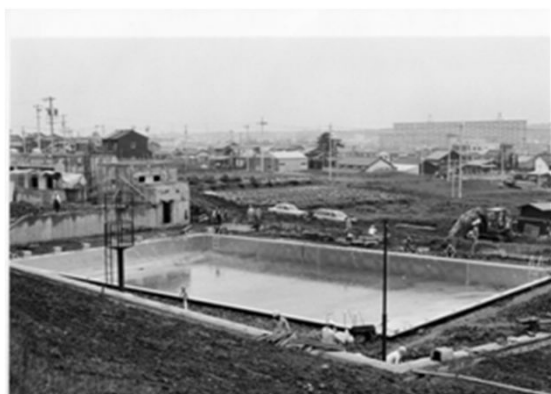
123 建設中の天白プール (昭和53年)