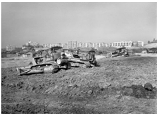
147 平針地区の開発 (昭和41年)