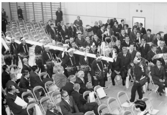
129 平針木遣り音頭 (民俗芸能)