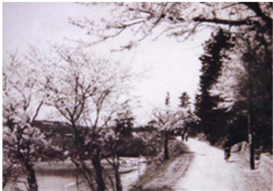
139 相生山南側の道路と鳴子池 (昭和36年)