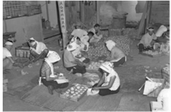
134 暖地リンゴの選別 天白果樹撰果所 (昭和31年)