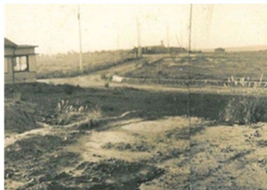
148 相生山住宅建設予定地付近 (昭和41年)