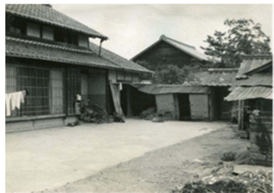
136 区内農家 (昭和30年代)