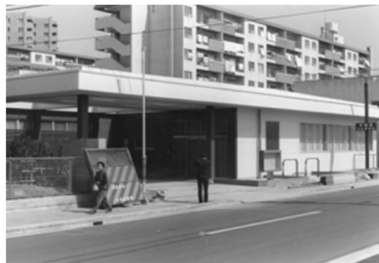
122 完成間近の水道局天白業務所 (昭和52年頃)