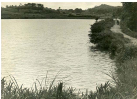
141 大堤池 (昭和30年代)