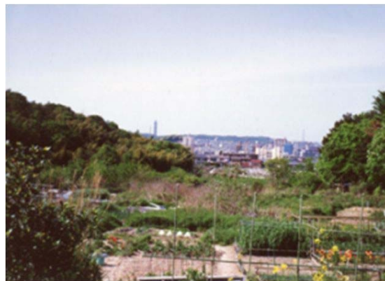
128 天白公園整備予定地 (平成4年)