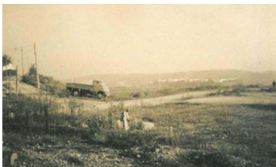
149 一つ山(土原方面) (昭和41年)