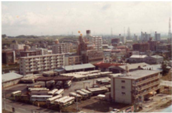
127 交通局天白営業所 (昭和57年)