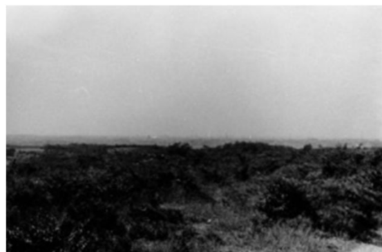
142 相生山 (昭和39年)