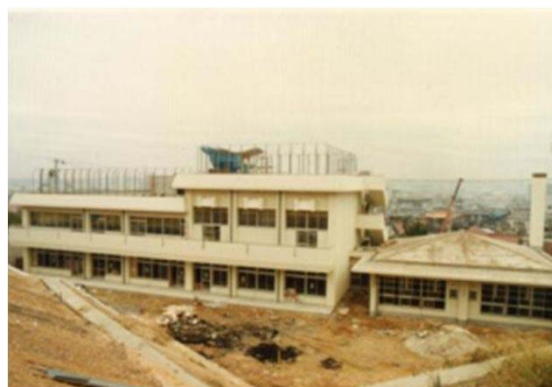
124 完成間近の天白福祉会館・児童館 (昭和53年頃)