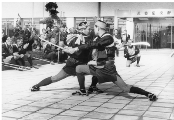
131 棒の手 (民俗芸能)