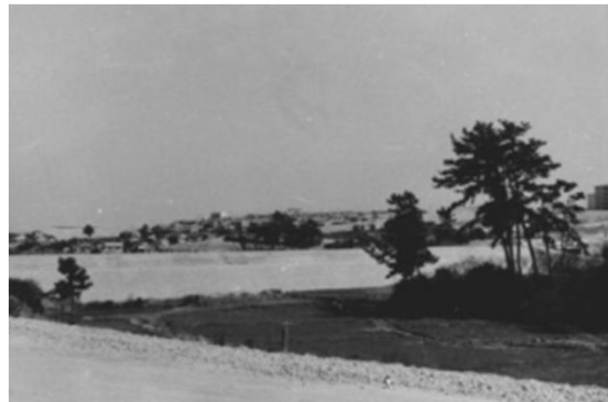
140 鳴子北付近 (昭和39年)