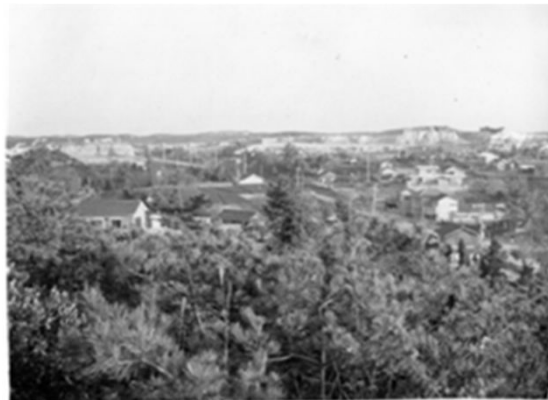
146 土原一丁目より一つ山方面 (昭和40年頃)