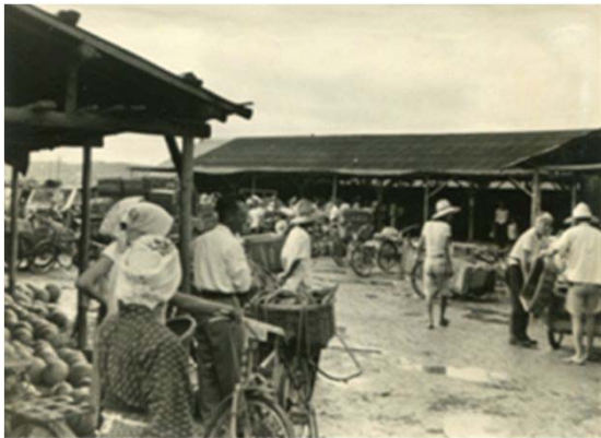
135 天白青果市場 (昭和30年代)