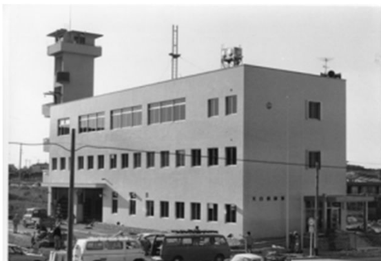
121 完成間近の天白消防署 (昭和50年頃)