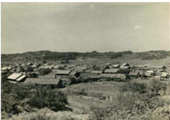
137 平針小学校から植田方面を望む (昭和30年代)