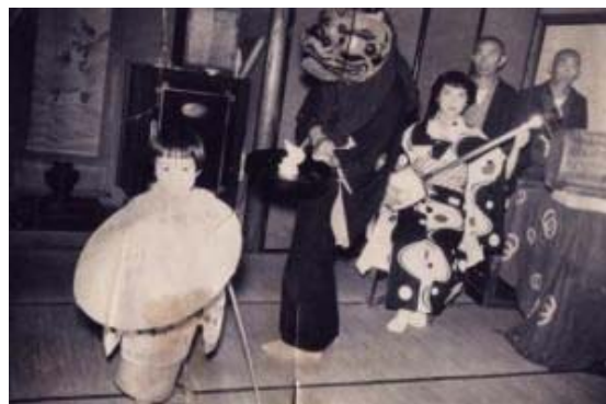
130 菅田嫁獅子 (民俗芸能)