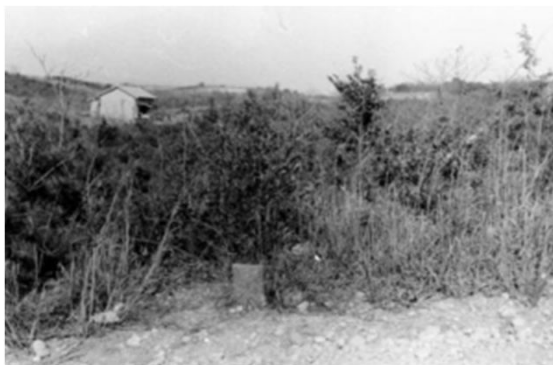
143 相生山緑地 (昭和39年)