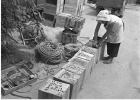
133 暖地リンゴの出荷作業 (昭和31年)