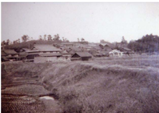
11 野並 古川町 (昭和32年)