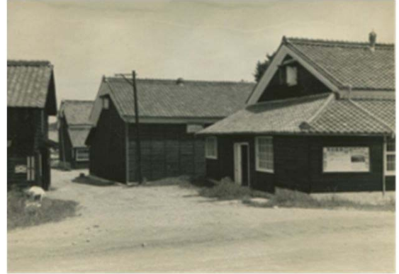
20 天白農業協同組合 (昭和30年代)