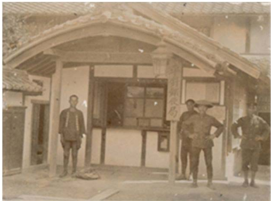
1 平針郵便局 (明治26年)