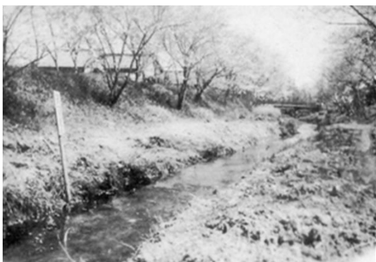
3 地藏川 (戦前)