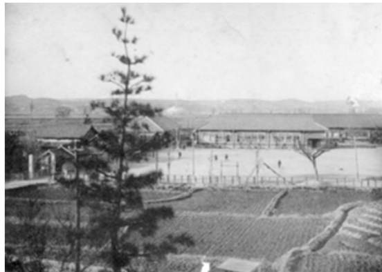
2 天白小学校 (戦前)