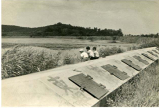
19 平池 (昭和30年代)