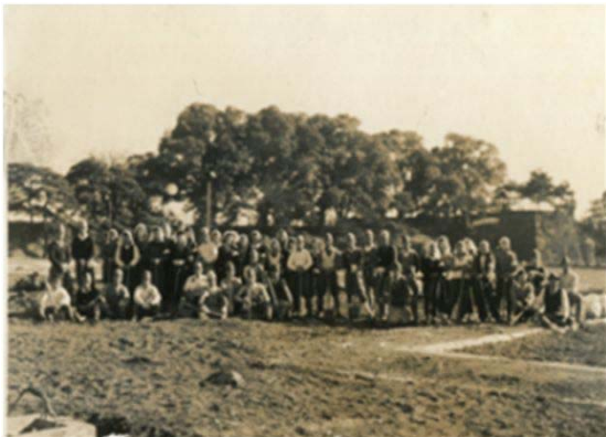
9 天白青年団宮城奉仕② (昭和22年頃)