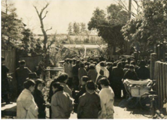
13 地蔵寺御堂落慶式 (昭和35年頃)