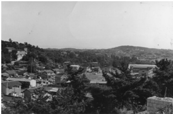
21 八事霊園より権現山を望む (昭和44年)