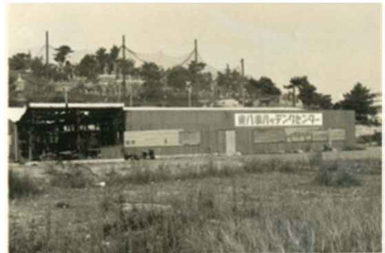
22 東八事バッティングセンター (昭和40年代)