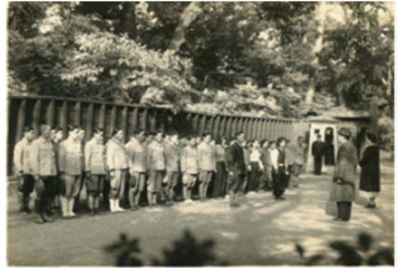
8 天白青年団宮城奉仕① (昭和22年頃)