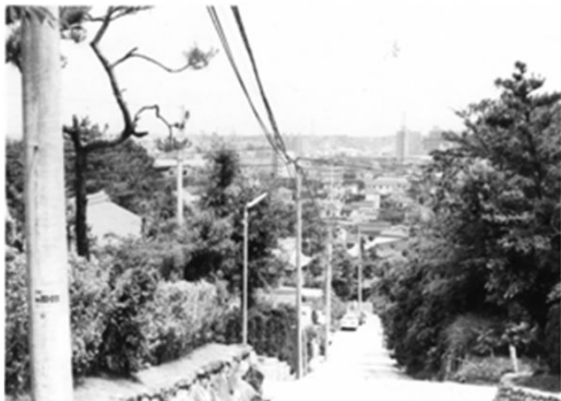
25 塩竈神社北側道路 (昭和54年)