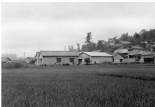
17 稲葉山南麓付近 (昭和30年代)