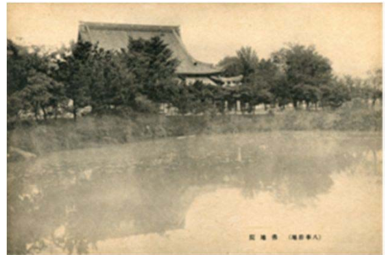
16 仏地院 (昭和30年代)