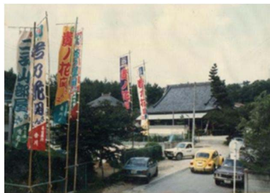
28 仏地院 大相撲のぼり (昭和55年)