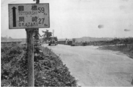
7 植田川植田橋 (年代不詳)