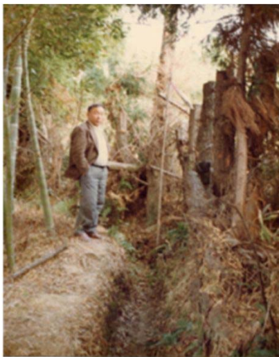
23 名東区との境界付近 (昭和52年)