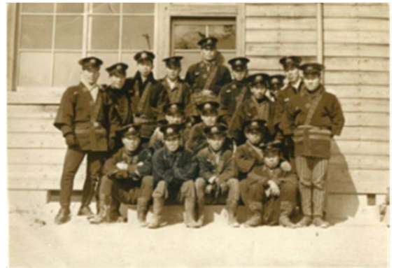
10 天白村消防団植田分団 (昭和25年頃)