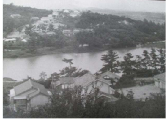
14 天白溪 下池 (昭和30年代)