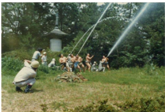
27 仏地院 名古屋場所 (昭和55年)