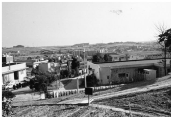
29 植田山より植田方面を望む (昭和50年代)