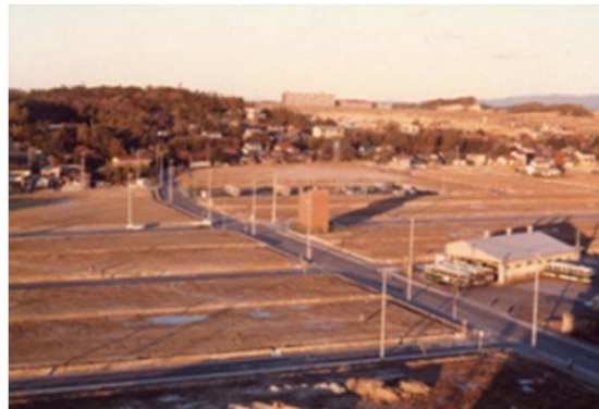
26 天白川付近より北方を望む (昭和55年)