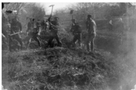
4 地藏川 (戦前)