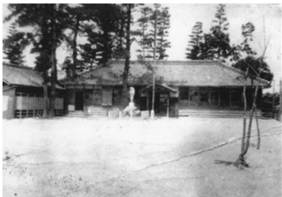
5 平針分教場 (戦前)