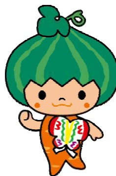
天白区マスコットキャラクターかぼっち