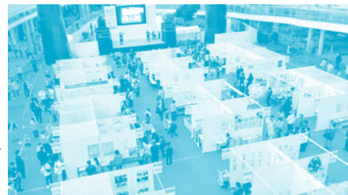
▶なごやエシカルフェア☆2022の様子

令和4年度は11月26日に「なごやエシカルフェア☆2022」として開催し、多くの市民の皆様にご来場いただきました。