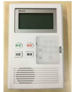
特殊詐欺対策アダプタ

初期費用を名古屋市が負担し※ 4 、特殊詐欺被害が多発している地域を重点に、警察の協力を得て設置を勧奨します。