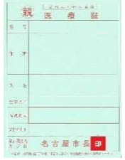
ひとり親家庭等医療証