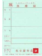
ひとり親家庭等医療証