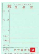
ひとり親家庭等医療証