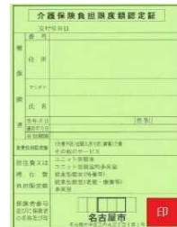
介護保険負担限度額認定証