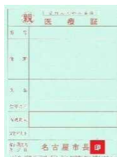
ひとり親家庭等医療証