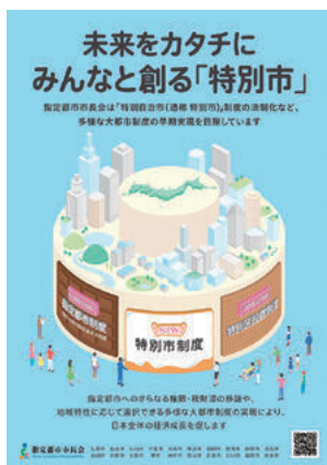
指定都市市長会ポスター

また指定都市市長会では、「特別市」制度の創設に向けて指定都市が一体となって情報発信を行うため、ポスター及びチラシを作成しました。