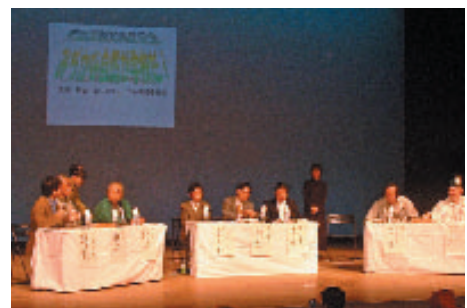
天白・もりのフォーラム シンポジウム

また、荒池なごやかファームの整備について、「荒池ふるさとクラブ」を中心とした市民の主体的な活動を支援します。