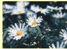
区の花/マーガレット

天白区の「て・ん」の二文字を組み合わせ、区民が、がっちりと手を組み、協力していく姿をデザイン化。中心のどがった形は、区の未来への発展を表現。色は緑豊かな天白区を表現しています。