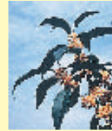
区の木/キンモクセイ