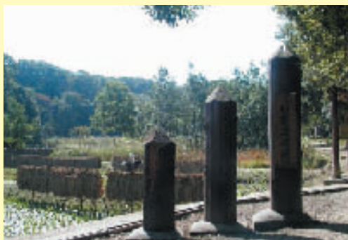
猪高緑地 晩秋の棚田