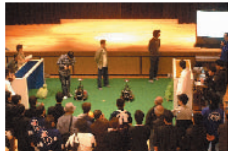
魅力発見フェスティバル