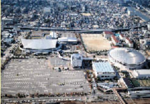
日本ガイシ スポーツプラザ (名古屋市総合体育館)