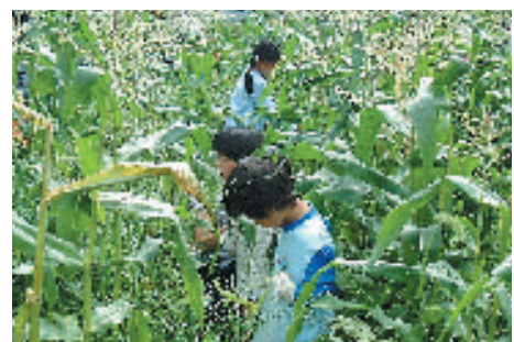
トウモロコシの収穫