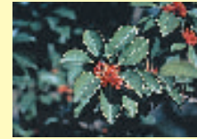
区の木/クロガネモチ