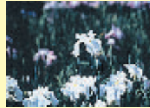
区の花/ハナショウブ

アツタの「ア」を図案化したもので、上部の矢先で区の発展を、下部の円形で区民の連帯と和を表しています。