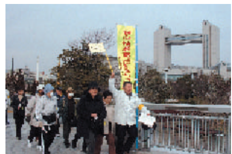
熱田ぐるりんウォーキング