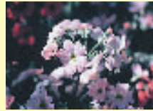
区の花/さくらそう

英語の西=WESTの頭文字Wをデザイン化。丸のつらなりで区民の連帯を象徴し、一丸となって豊かな明日をひらくエネルギーを表現しています。