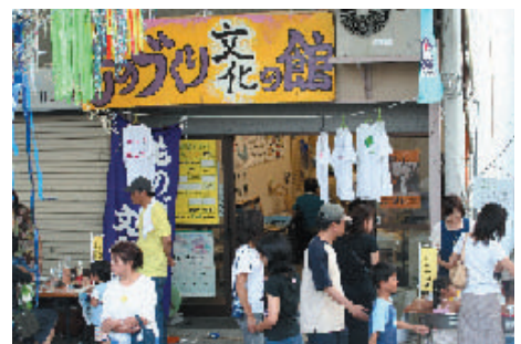
ものづくり文化の館 IN円頓寺七夕まつり