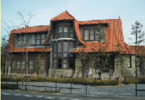
文化のみち二葉館（旧川上貞奴邸）