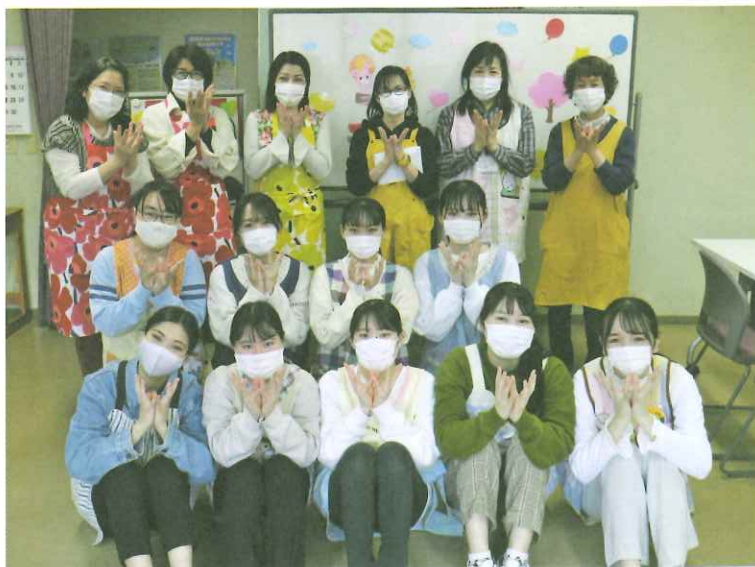
御器所チューリップの会のみなさんと

本学では平成19年度より、昭和区の各種機関と連携した地域貢献活動「笑顔の子育て応援プロジェクト」に取り組んでいます。具体的には、長谷中ゼミ生を中心とした有志学生による支援団体「たんぽぽくらぶ」を発足させ、昭和区役所や保健センター、社会福祉協議会、主任児童委員等と連携しながら毎月、①未就学児と母親を対象とした子育てサロンの開催や②御器所チューリップの会など地域への参加活動を行っています。歴代のゼミ生が大切に引き継ぎながら、今年度で15年目。「限られた条件の中で最高の準備と実践ができてこそプロ」を合言葉に、季節に合わせた親子で楽しめる企画を学生達が手作りで準備しています。