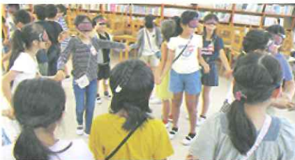
福祉教育(アイマスク体験)

令和2年度実績総額 2,991,000円 個人 805件、1691口 法人・団体 107件、130口