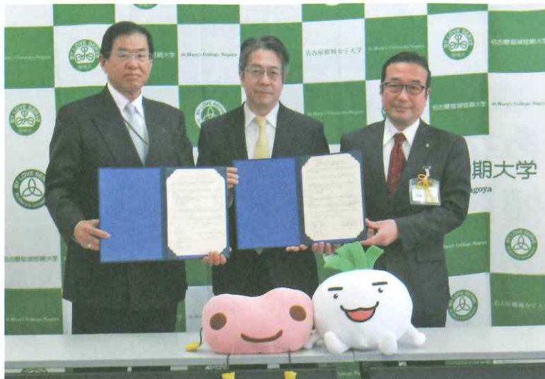
▲ 協定締結の様子。同時に昭和区役所と名古屋柳城女子大学・名古屋柳城短期大学の間でも包括連携協定が締結されました。

今後も、昭和区の地域福祉推進や人材育成をともに進めていくことを目的として包括連携協定を締結しました。