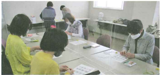
なごや人権啓発センター ソレイユプラザなごや ▶▶▶ https://www.jinken.city.nagoya.jp/data/emg.php