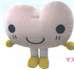
マスコットキャラクター「こころん」