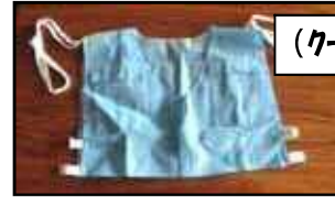
(クールベスト・夏期)