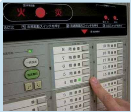
② 放送階選択ボタンを押す