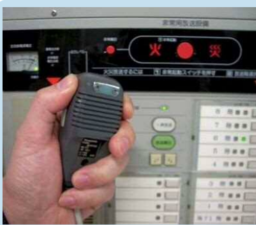
③ プレストークスイッチを押し放送する