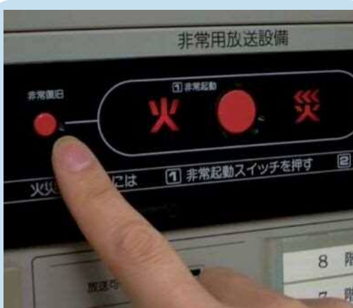
非常復旧ボタンを押す