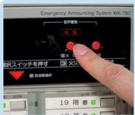
状況に応じて音声警報スイッチ（火災・非火災）を押す