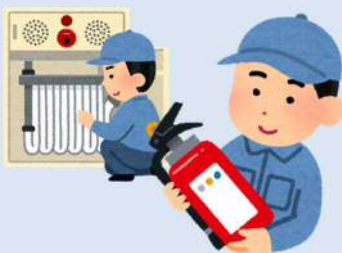
消火器などの維持管理