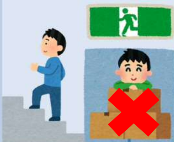
避難施設の維持管理