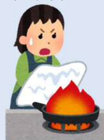
火気の取り扱いの監督