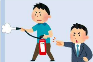
従業員の教養訓練