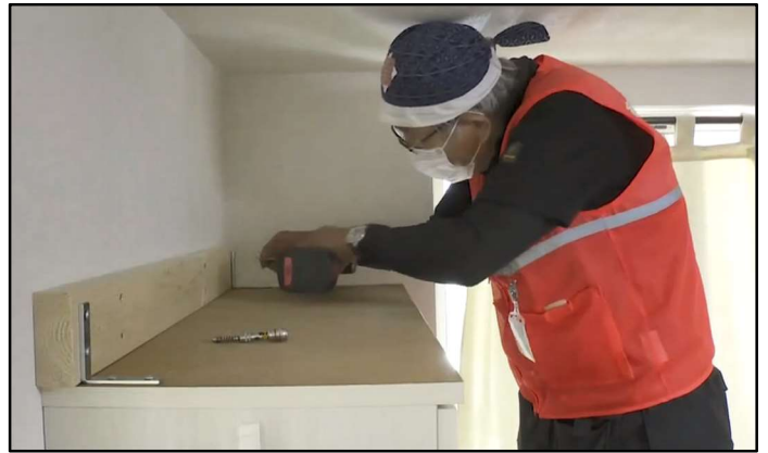
実際の施工の様子