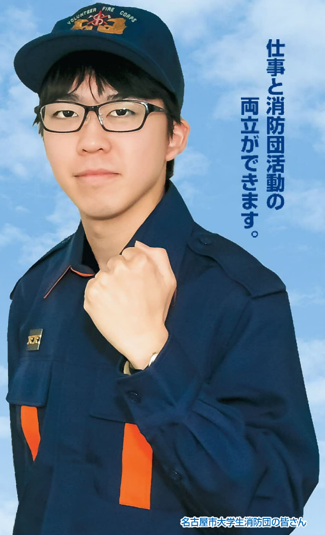
名古屋市大学生消防団の皆さん