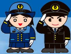
名古屋市消防団マスコット 「だんちゃん」「だんくん」