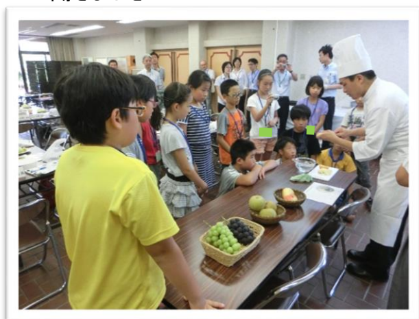
① 果物の飾り切りを学びました