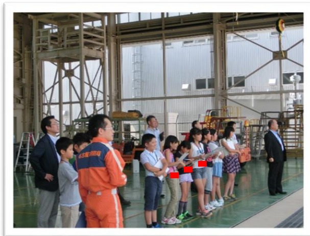
① 模擬出動を見学しました