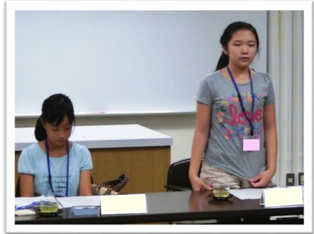
① 司会を行う委員長と副委員長

科学館は、天文館・理工館・生命館の3館があり、見て、触 ふ れて、体験しながら、楽しく科学の学習ができます。