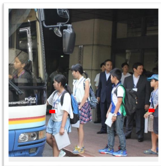
①施設見学に出発する子ども議員①