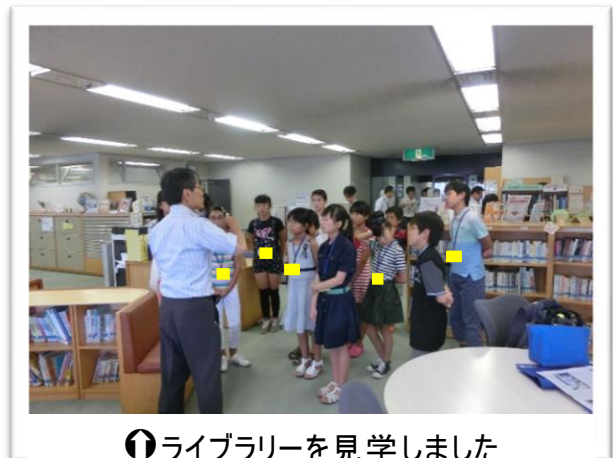
① ライブラリーを見学しました