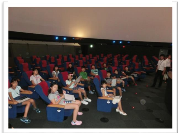
① プラネタリウムのドーム内を見学しました