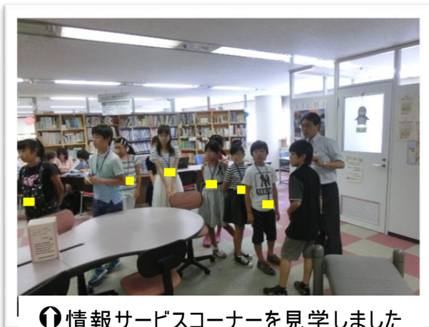
① 情報サービスコーナーを見学しました