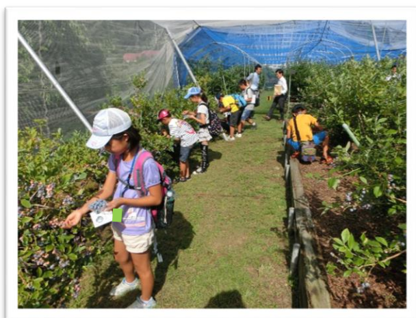
① ブルーベリーの収穫体験をしました