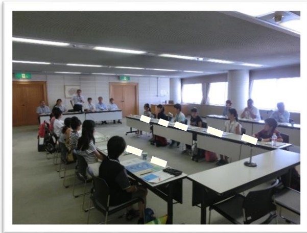
① こくさい 国際センターの説明を聞きました