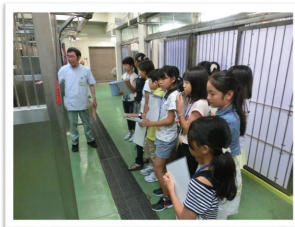
① 収容されている動物の様子を見ました