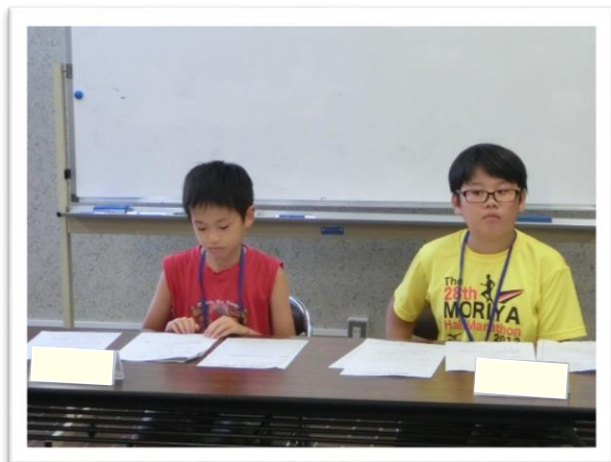
① 司会を行う委員長と副委員長

とうごくさん 東谷山フルーツパークは、世界の熱帯果樹温室や果樹園など、世界の果物が楽しめるフルーツのテーマパークです。