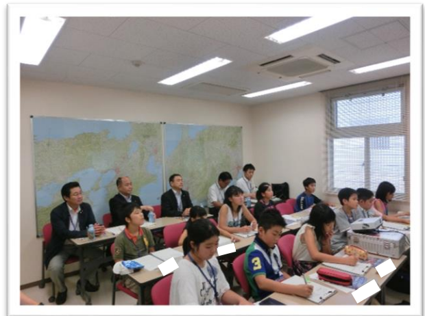
① 消防航空隊の説明を聞きました