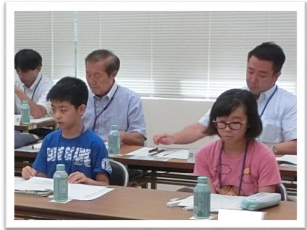
① 司会を行う委員長と副委員長

水の歴史資料館 しりょうかん は、上下水道事業の歴史や役割 やくわり 、災害への備えなどを学ぶことができる施設 しせつ です。