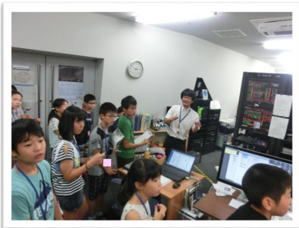
① プラネタリウムのバックヤードを見学しました