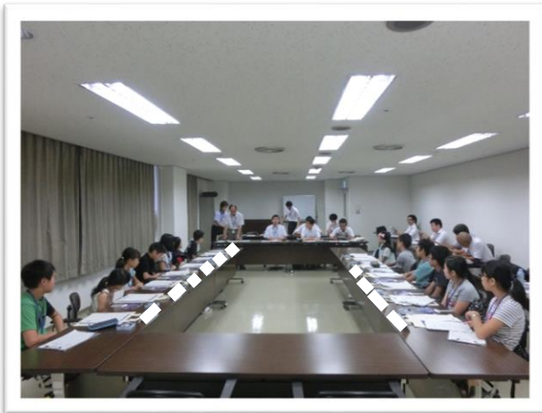
① 科学館の説明を聞きました