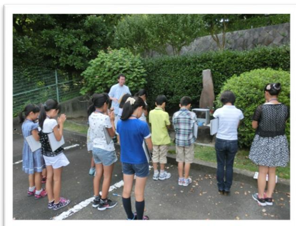
① センターで亡くなった動物の慰霊碑にみんなで手を合わせました