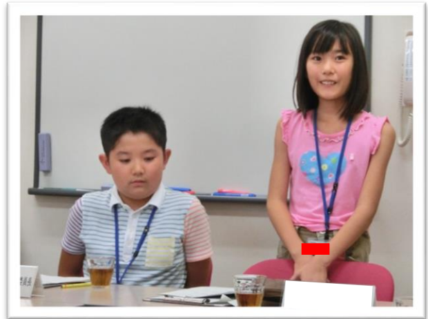
① 司会を行う委員長と副委員長

消防航空隊 しょうぼう は、ヘリコプターを使い、震災時 しんさい の人命救出 かさい や火災での消火活動などを行っています。