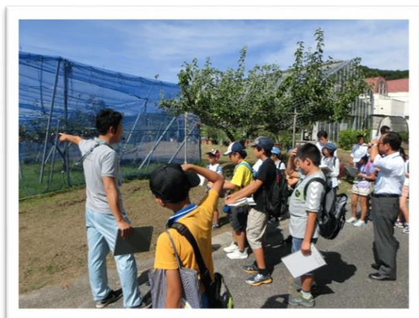
① 果樹園を歩き、果物の育て方の説明を聞きました