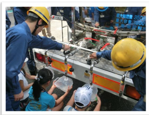
① 応急給水車 おうきゆう から水を受け取る体験をしました