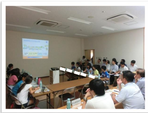
① 水の循環 じゆんかん について説明を聞きました