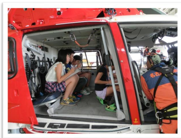
① ヘリコプターに乗り説明を聞きました