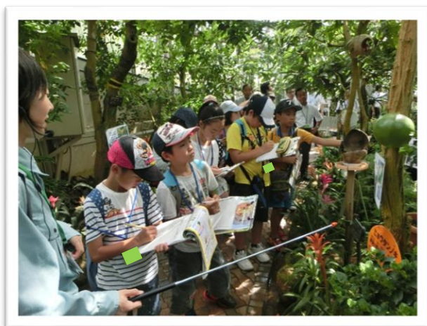
① 熱帯果樹の説明を聞きました