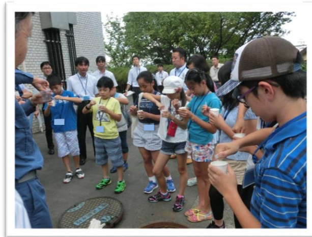
① 地下式給水栓 せん かんすいしつけんさ の簡易水質検査を体験しました