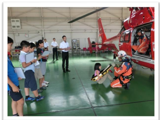
① ヘリコプターの機材で救助体験をしました