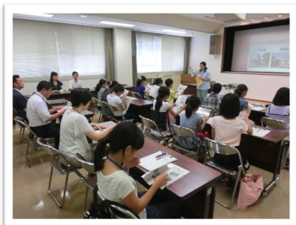
① 動物愛護センターの説明を聞きました