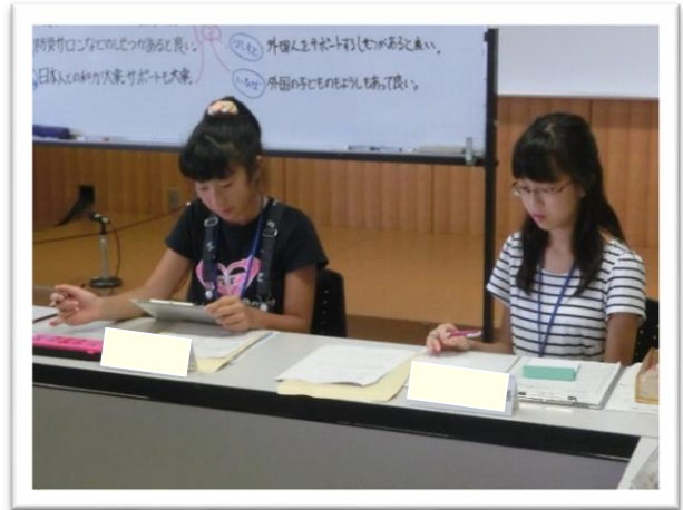
① 司会を行う委員長と副委員長

こくさい 国際センターは、外国人の方への日常の生活情報の提供や国際交流事業などを行っています。