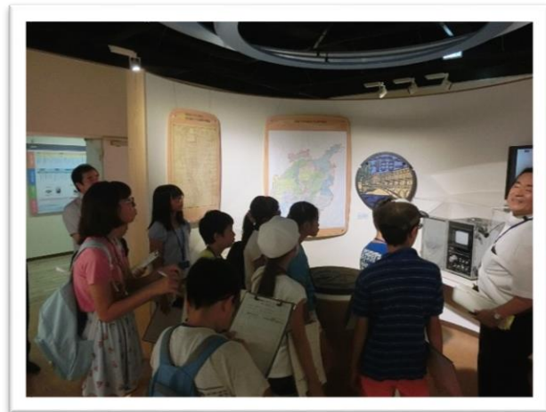
① 上下水道事業の歴史について説明を聞きました