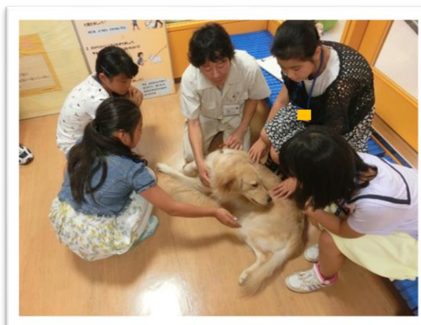
① 動物との触れ合い体験をしました