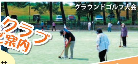
グラウンドゴルフ大会

現在、西区では約3,300の方が老人クラブで活動しており、レクリエーションやボランティアなどを通じて「健康づくり」「生きがいづくり」を行っています。 区内在住でおおむね60歳以上の方は、どなたでも入会できます。