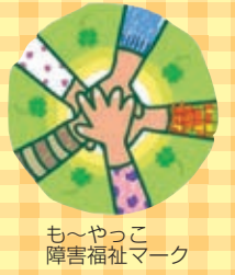
も～やっこ 障害福祉マーク

障害のある人もない人も お互いに人格と個性を尊重 しながらともに生きる地域 共生社会をめざし、障害の ある人の社会参加や地域交 流を進める事業に取り組ん でいます。