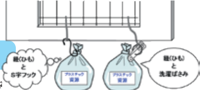
洗濯ばさみとS字フック