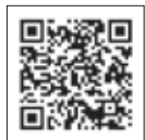
西土木事務所 だより