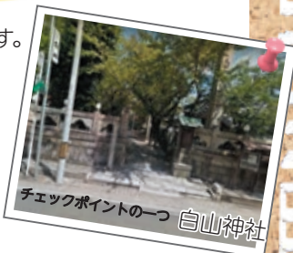
チェックポイントの一つ 白山神社

申込:9/16(金)午後5:15までに窓口、 9/17(土)までにファクス、 電子申請にて(⑦面参照)