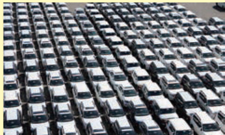
輸出を待つ自動車