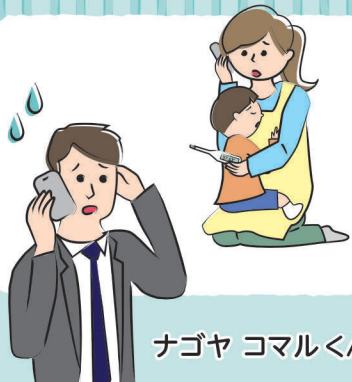
ナゴヤ コマルくん

保育所から「お子さんの体調が悪いのですぐにお迎えに来てください。」という連絡が入った。今日はお迎えに行けるけど、明日は重要な会議が入って休めない…。妻も出張…。困ったなあ。