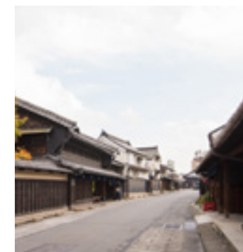
有松の町並み Arimatsu townscape