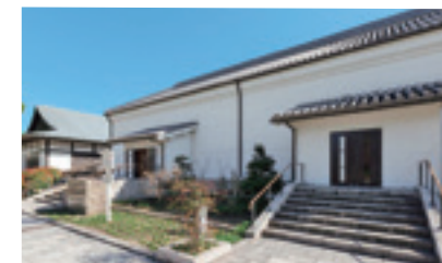
名古屋市蓬左文庫 Hosa Library, City Of Nagoya