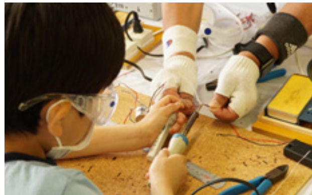
ものづくり教室 Manufacturing Craftsmanship Class

Messe Nagoya began in 2006 with the goal of expanding sales channels and cross-industry interaction for small and medium enterprises. Corporations and organizations in a variety of industries and business categories from Japan and around the world gather at Port Messe Nagoya for this cross-industry exhibition with the largest scale and widest-ranging content in Japan, creating new business opportunities.