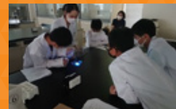
瑞穂区役所連携事業「薬学教室」 Mizuho Ward Office collaborative project “Pharmacy Classroom”

The university collaborates with local communities to work on resolving local issues and provide lifelong learning opportunities. The entire university unifies to contribute to creating attractive local communities.