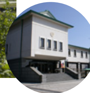
徳川美術館 Tokugawa Art Museum

This place originated when the second lord of the Owari ) Tokugawa clan, Mitsutomo, built a retreat. In 2004, a chisen-kaiyu-teien (strolling pond garden), which is a typical daimyo-style garden, was placed in the garden. In addition, there is the Tokugawa Art Museum, which houses the national treasure Genji Monogatari Emaki (The tale of Genji Illustrated Scrolls) as well as a large number of collections from the Owari ) Tokugawa family. There is the Hosa bunko (Hosa library) which houses old collections of the Owari Tokugawa family and excellent classic books of Japan and China. These collections are open to the public.