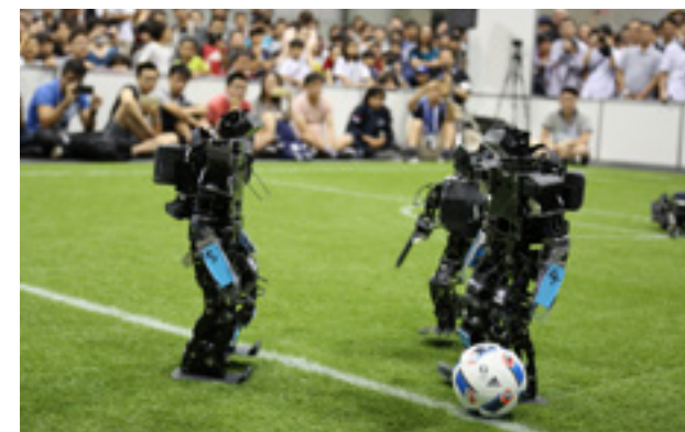
ロボカップ2017名古屋世界大会 RoboCup 2017 Nagoya Japan

In July 2019, to accelerate the creation of new value by companies, Nagoya City has established “NAGOYA INNOVATOR'S GARAGE” with the aim of supporting innovation in the Sakae area. This is a platform for entrepreneurs and enterprises to collaborate with each other. It was enlarged and reopened in July 2022. In addition, we have opened “NAGONO CAMPUS” near the Meieki area, which can be used as a training facility for start-up companies. Utilizing these two facilities, we will support innovation and the creation of start-ups. In July 2020, Nagoya City was selected as a “Global Startup City” of startup ecosystem strategies by the Cabinet Office. We will cooperate with the business community and universities to help startups grow and further develop the regional economy.