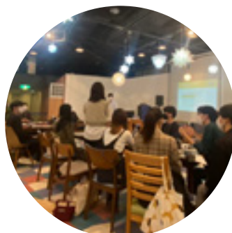
学生共同活動拠点「N-base」 Students' joint activity base "N-base"

Nagoya City has entered into sister and friendship city agreements with the following cities: Los Angeles in the U.S.A., Mexico City in Mexico, Nanjing in China, Sydney in Australia, Turin in Italy, and Reims in France. In addition, we have also established partner city agreements with Taichung in Taiwan and Tashkent in Uzbekistan. We will continue to promote various international exchanges in the future.