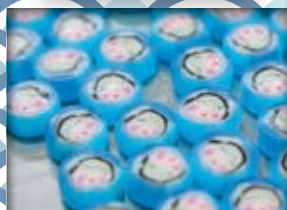
菓子の製造・問屋

問合せ ものづくり文化の道推進協議会 事務局 地域力推進課 ☎ 523-4525 ナゴノスペース (名駅二丁目27-6) ☎ 589-2770