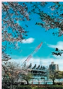
第23回さくら大賞 受賞作品 「歓迎 アジア大会」