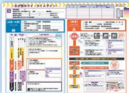
マイ・タイムライン

災害が迫った時、命を守るために、「いつ」「誰が」「どのように行動するのか」を時間の流れに沿って考えておくものです。あらかじめ時系列にまとめ、整理しておくことで、いざという時に慌てずに避難するのに役立ちます。ご家庭や町内会の集まりなどでマイ・タイムラインを作成しながら、避難行動について考えましょう。