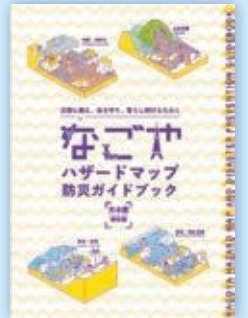
なごやハザードマップ防災ガイドブック