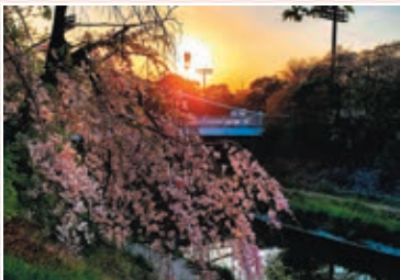
第21回さくら大賞 受賞作品「夕桜」

※サクラの花だけを被写体とした写真、人物が主体となった写真は応募の対象となりません。詳細は募集要項をご確認ください。