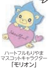
ハートフルもりやま マスコットキャラクター「モリオン」