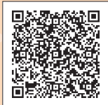
南区自転車等放置禁止区域・自転車駐車場MAP