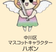
中川区 マスコットキャラクター ハボン