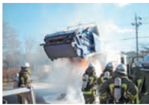
↑燃えている収集車(イメージ)