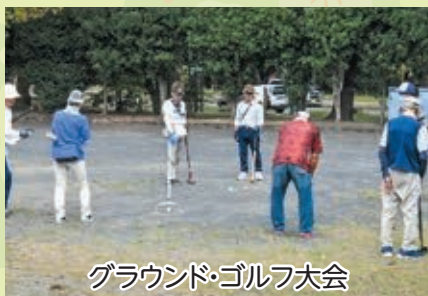
グラウンド・ゴルフ大会

入会に興味のある方は 下記までお気軽にお問い合わせください。 お待ちしております。