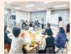
▲今年度実施している清水学区でのワークショップの様子

北区では、学区ごとに高齢者の健康データや地域資源などをまとめた「健康つながりまちカルテ」を活用したワークショップを開催しています。高齢者の暮らしについて学区の特徴や課題、取組みアイデアを話し合い、開催後には各学区特色ある魅力的な取組みの実現につながっています。