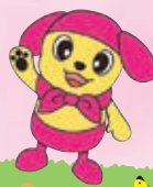
楠地区マスコットキャラクター「くすのち」