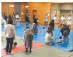
親子ふれあいあそび