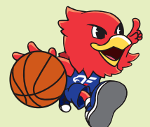
ファイティングイーグルス名古屋 マスコットキャラクター リードくん