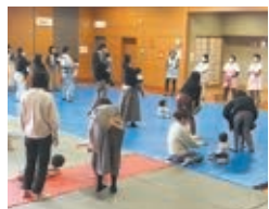
親子ふれあいあそび