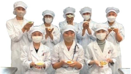
梶山女学園大学の学生のみなさん