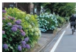
すいどうみち緑道

桜並木で有名な「すいどうみち緑道」は、これからの季節区の花アジサイもきれいです。学問の神様菅原道真公をまつり、境内のあちらこちらにかわいらしい道真人形が並ぶ上野天満宮。初夏には一面のコリが見事な千種公園などをめぐるコースです。