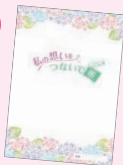
千種区版エンディングノート「私の想いをつないで帳」

区役所第2駐車場はスポーツセンター駐車場から入場した所にあります。ご利用ください。