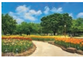
千種公園 (令和3年度フォトコン入賞作品)