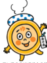
愛知県公衆浴場業生活衛生同業組合 キャラクター「おけお」

問合せ 愛知県公衆浴場業生活衛生同業組合 (☎322-5735・FAX321-2645) 健康福祉局高齢福祉課 (☎972-2544・FAX955-3367)