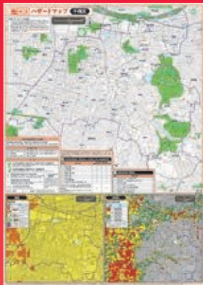
地震ハザードマップ