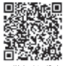
▲災害時に役立つ施設の検索はこちら

地域の皆さまが自ら操作して飲料水を確保できます。操作に必要な機材は、小中学校に保管してあります。