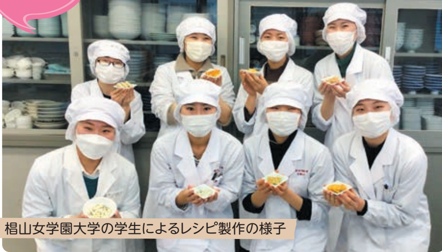
椋山女学園大学の学生によるレシピ製作の様子